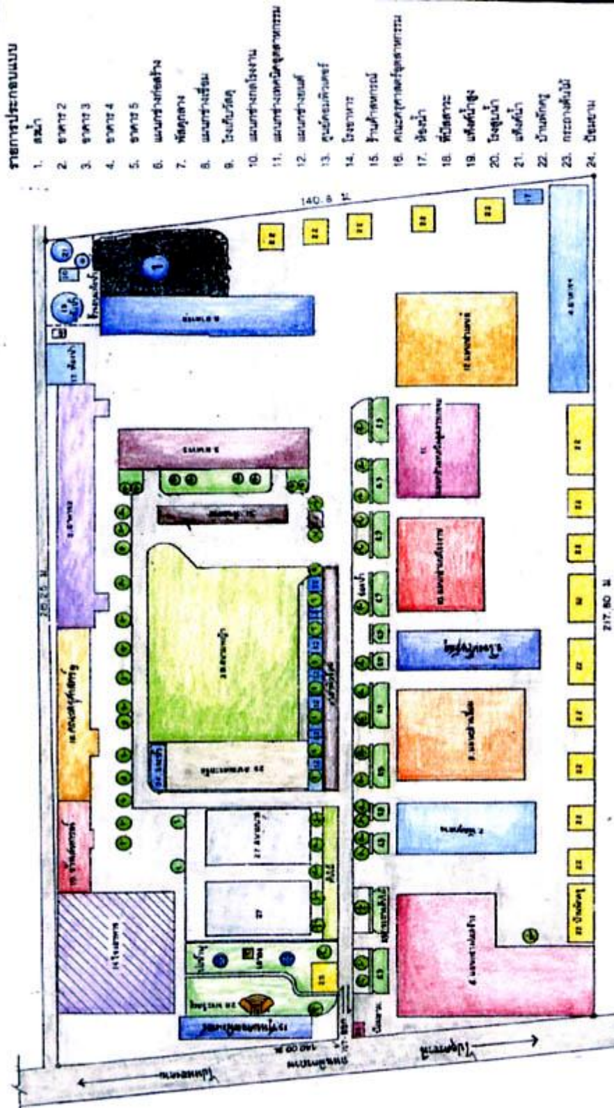
รายการประกอบแบบ